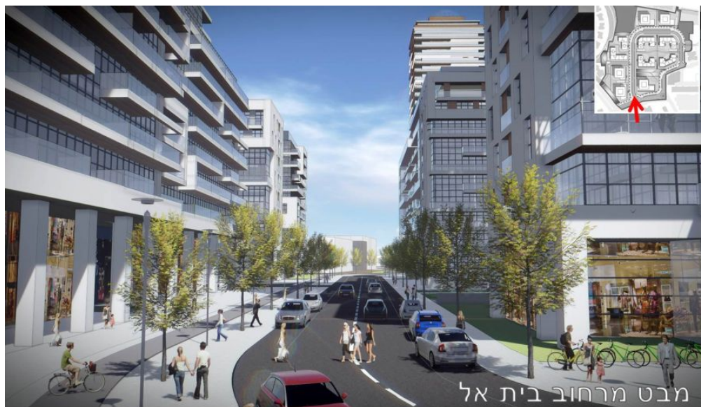
קרדיט: טיטו אדריכלים

התכנית חלה על שטח של כ-50 דונם במתחם הרחובות אח"י דקר, בית אל ודבורה הנביאה בשכונת נווה שרת. תכנית המתאר לעיר (תא/5000) קבעה את השכונה כשכונה הראויה להתחדשות עירונית וציפוף.