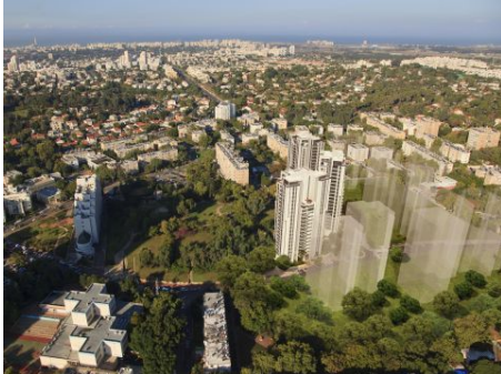
נווה שרת [הדמיה]

הוועדה המקומית דחתה ערעור על התוכנית, ועתה מתקדמים היזמים לקראת אישור סופי - חברה בשליטת משפחת שמני תפנה 451 דיירים, ותבנה 1,170 דירות ב-13 מגדלים בנווה שרת